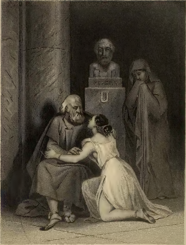
Alfred Johannot del.

Alors Cynodocée flattant son vieux père de ses belles mains et caressant sa barbe argentée